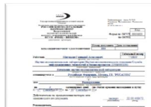
Управляющие печатные формы